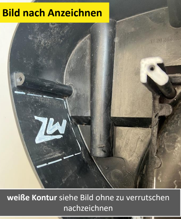
weiße Kontur siehe Bild ohne zu verrutschen nachzeichnen