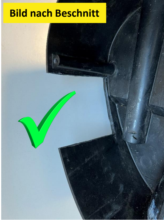
Bild nach Beschnitt